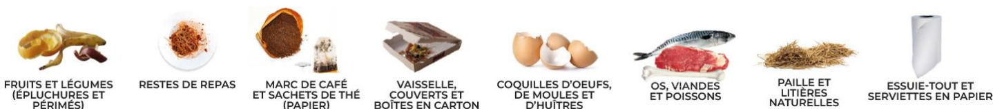
FRUITS ET LÉGUMES (ÉPLUCHURES ET PÉRIMÉS)