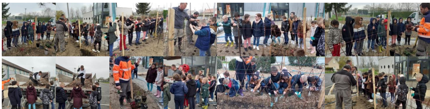
Sans oublier la participation des enfants de l'École Primaire Fernand VITRY.